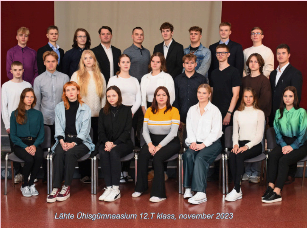
Lähte Ühisgümnaasium 12.T klass, november 2023