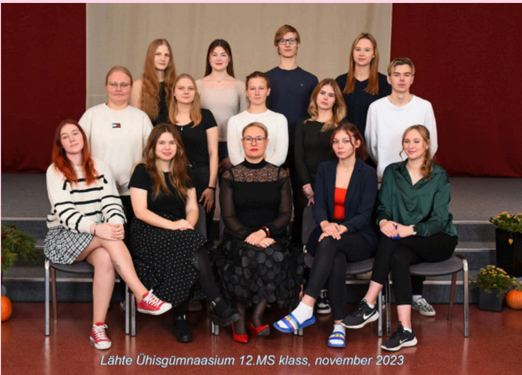
Lähte Ühisgümnaasium 12.MS klass, november 2023