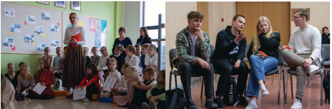
Hetki emakeelepäeval toimud aktuselt ja võistlustelt.